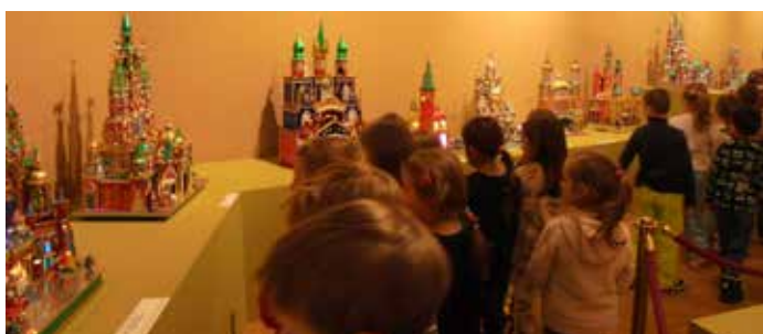
Biedronki oglądające wystawę.

Aby szopki mogły zostać zakwalifikowane do konkursu, muszą spełniać szereg kryteriów. Przede wszystkim szopki trzeba wykonać z ściśle określonych materiałów, takich jak: drewno, papier kolorowy, bibuła, staniol, czy celofan.