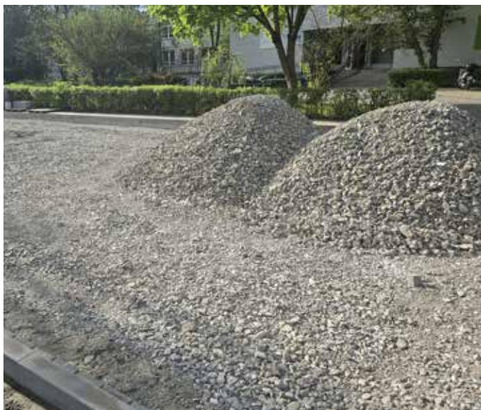
Remont parkingu przy ul. Seniorów Lotnictwa.

Przewodniczący Rady i Zarządu Dzielnicy III Prądnik Czerwony