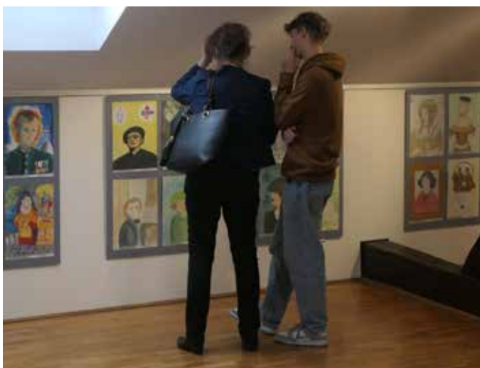
Otwarcie wystawy w galerii „Na Strychu” Młodzieżowego Domu Kultury przy al. 29 Listopada 102.

Członek Zarządu Dzielnicy III Prądnik Czerwony Jeden z inicjatorów konkursu