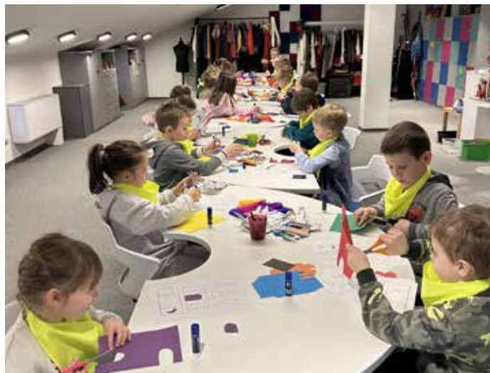
Motylki w trakcie warsztatów szopkarskich.

Ponadto każda szopka powinna posiadać co najmniej dwie wieże, składać się z kilku poziomów oraz nawiązywać do architektury krakowskich budynków. Wszystkie szopki powinny charakteryzować się bogactwem kolorów i detali. Ich centralnym punktem jest Święta Rodzina z Dzieciątkiem Jezus, której towarzyszą postacie pochodzące z tradycji chrześcijańskich, jak również związane z tradycją, historią i legendą Krakowa. Są to np. Trzej Królowie, pastuszkowie, ludność w strojach regionalnych, czy legendarny Smok Wawelski i Lajkonik. Często występują też symbole narodowe. Figurki znajdujące się w szopkach przedstawiają różne scenki zarówno te z życia codziennego, jak i sceny biblijne. Specjalnie skonstruowane mechanizmy poruszając figurki i odpowiednio zaaranżowane podświetlenia dodają szopkom tajemniczości oraz niezwykłości.