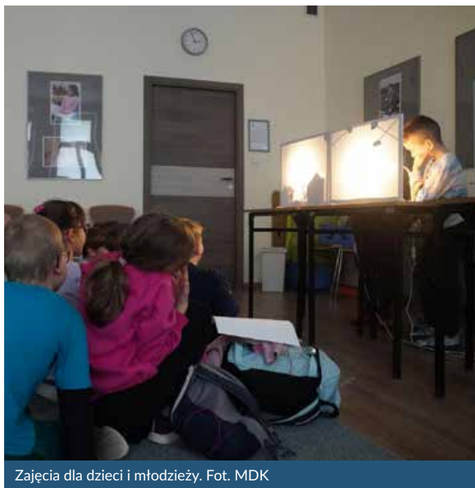
Zajęcia dla dzieci i młodzieży.

Pracownia Animacji Kultury Młodzieżowy Dom Kultury przy al. 29 Listopada 102