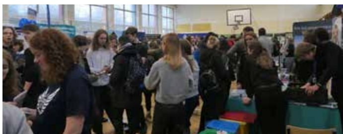
Sala gimnastyczna z trudem mieściła prezentujących się i zainteresowanych.

16 stycznia 2025 r. w Zespole Szkół Inżynierii Środowiska i Melioracji w Krakowie, mającym swoją siedzibę przy ul. Ułanów 9, odbyła się dwudziesta trzecia edycja „Targów Szkół Technicznych i Branżowych w Meliorku”. Jest to wydarzenie o charakterze informacyjno – edukacyjnym mające na celu przybliżenie obecnym ósmoklasistom oferty edukacyjnej krakowskich szkół technicznych i branżowych.