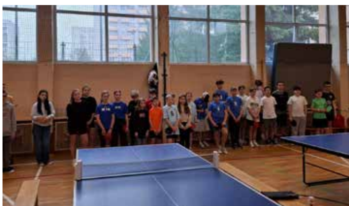
Dzielnicowy turniej tenisa stołowego.

Bogusław Wawro Nauczyciel Szkoła Podstawowa nr 64