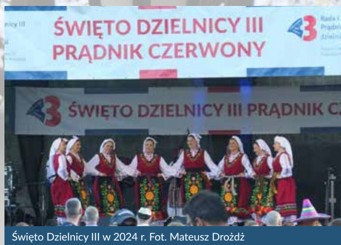
Święto Dzielnicy III w 2024 r.

Tak bawiliśmy się rok temu. I tak możemy bawić się w sobotę 14 czerwca 2025 r. na stadionie Klubu Sportowego Wierzyta Kraków przy ul. Kazimierza Chałupnika 16.