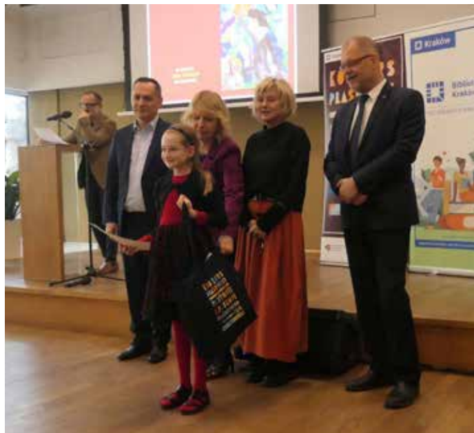
Nagradzanie najlepszych.

38 laureatów i wyróżnionych to efekt tegorocznej, dwunastej już, edycji konkursu plastycznego „Patronki i Patroni Krakowskich Ulic”. Konkurs był przeznaczony dla dzieci i młodzieży w trzech grupach wiekowych – uczniów uczęszczających dla klas 1-3, 4-6 oraz 7-8 i ze szkół ponadpodstawowych. Zadaniem startujących było przedstawić w artystycznej formie plastycznej lub kreatywnej w formie lapbooka wybranego przez siebie patrona którejś z krakowskich ulic, osiedli, placów, skwerów, czy alei.