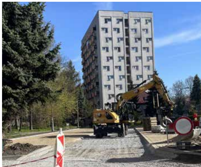
Remont parkingu przy ul. Sadowki przy bloku Młyńska 2.

Współpraca z Radnymi Miasta Krakowa jest niezbędna do realizacji ambitnych planów edukacyjnych i infrastrukturalnych, które stawiamy przed sobą, a których realizacja – z uwagi na ich koszty – często przekracza możliwości finansowe naszej Dzielnicy. Tylko w tym roku to rekordowe blisko sześć milionów złotych pozyskanych dzięki tej współpracy! Dzięki tym środkom uda nam się zrealizować szereg projektów, które poprawią jakość edukacji w naszej