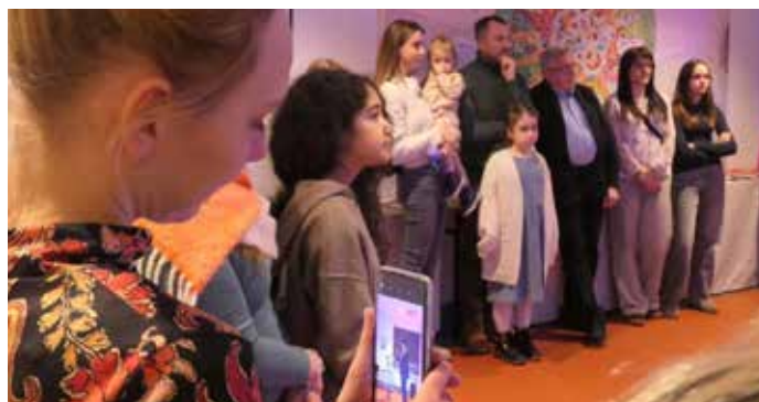
Otwarcie wystawy w siedzibie Liceum Sztuk Plastycznych CosinusYoung 15+ Kraków przy ul. Lublańskiej 38.