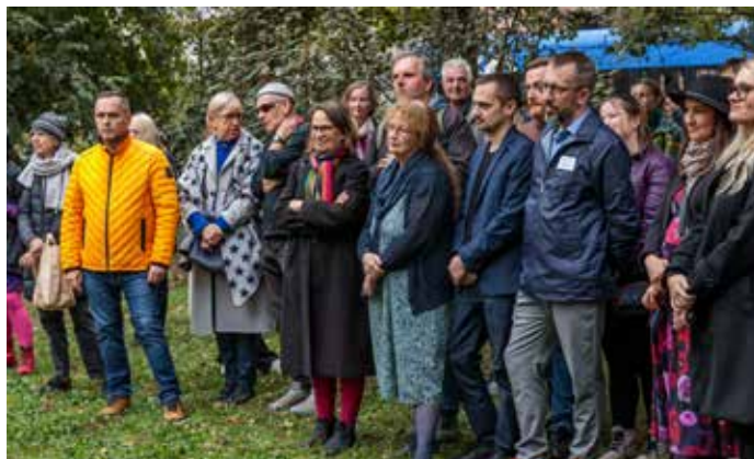
Uczestnicy performansu „Żywy Róż”.

z napisem „Żywy Róż”. Na koniec wypowiedziała głośno w językach polskim, niemieckim i francuskim pytanie „Czy wiosną róże zakwitną na różowo?”. Niecały miesiąc później w Polsce wprowadzono stan wojenny, a performans stał się rodzajem niespełnionej nadziei na lepsze. Róża nie zakwitła na wiosnę, a dotknięte represjami społeczeństwo pogrążyło się w marazmie.