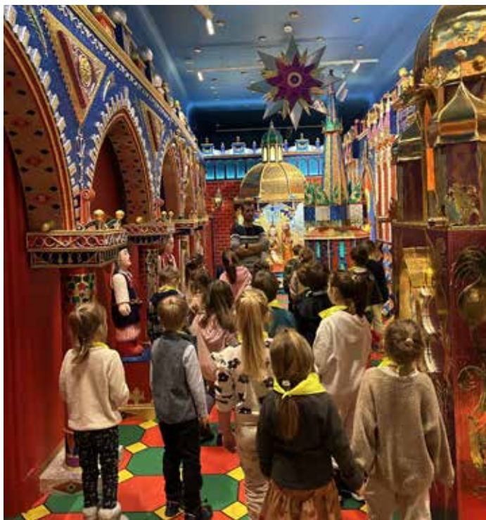
Motylki we wnętrzu szopki.

W zimowy poranek 8 stycznia 2025 r. dzieci z Samorządowego Przedszkola nr 178 w Krakowie przy ul. Sudolskiej 3 wybrały się na interesującą wycieczkę do Pałacu Krzysztofory mieszczącego się przy Rynku Głównym 35. Sześcioletki z grup „Biedronki” i „Motylki” wzięły udział w warsztatach pt. „Szopki krakowskie od A do Z”.