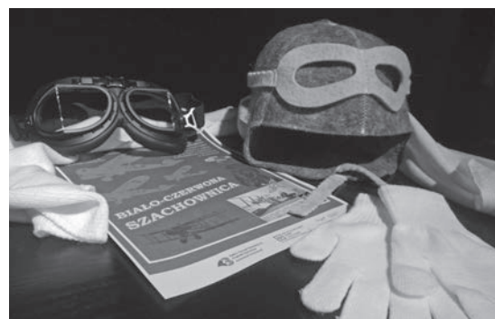
Rekwizyty potrzebne do przeprowadzenia interaktywnego widowiska.

temu biało – czerwona szachownica, znak dobrze znany wszystkim, stała się symbolem polskiego lotnictwa wojskowego.