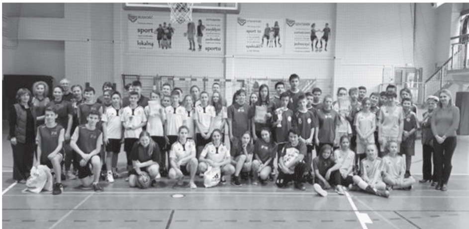
Turniej koszykówki o Puchar Przewodniczącej Rady Dzielnicy III z 21 listopada 2017 r.

Podczas kadencji członkowie Komisji Sportu i Rekreacji uczestniczyli w takich rozgrywkach jak np. „Turniej koszykówki o Puchar Przewodniczącej Rady Dzielnicy III”, czy „Mikołaj na sportowo”, organizowane przez Szkołę Podstawową nr 64, a także Turniej Sambo organizowany przez Klub Sportowy Prądniczanka. Dzięki braniu udziału w takich wydarzeniach, można było zauważyć, jak istotny jest ruch dla dzieci i młodzieży. Wystarczy odpowiednie zmotywowanie do uczestniczenia w zabawie poprzez organizację ciekawych rozgrywek