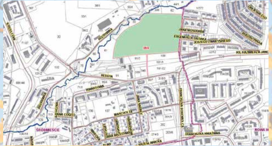
Usytuowanie przyszłego Parku Reduta.

Z inicjatywą budowy nowego Parku wystąpiłem w roku ubiegłym wychodząc naprzeciw oczekiwaniom mieszkańców wschodniej części Prądnika Czerwonego, którzy z zaniepokojeniem obserwowali postępującą zabudowę rejonu ulic Marchołta i Reduty. Budowę Parku poparli swoimi uchwałami zarówno Rada Dzielnicy III Prądnik Czerwony, jak też Dzielnicy XV Mistrzejowice. Ostateczną decyzję o budowie Parku Reduta podjęła 9 lipca 2014 roku Rada Miasta Krakowa przyjmując przygotowany przeze mnie projekt uchwały w tej sprawie.