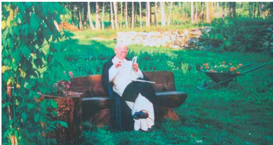
Zdjęcie Jana Pawła II z wystawy prezentowanej na krakowskich Plantach.

W czasie okupacji hitlerowskiej był w latach 1940-1944 robotnikiem w kamieniołomach na Zakrówku i w Zakładach Chemicznych „Solvay”. Jesienią 1941 roku wraz z przyjaciółmi założył Teatr Rapsodyczny, który swoje pierwsze przedstawienie wystawił 1 listopada 1941 roku. W 1942 roku rozstał się z teatrem i postanowił studiować teologię. Wstąpił do tajnego Metropolitalnego Seminarium Duchownego w Krakowie, gdzie 1 listopada 1946 roku z rąk kardynała Adama Stefana Sapiehy otrzymał święcenia kapłańskie. Kontynuował studia w Rzymie, Belgii i Francji. W 1948 roku uzyskał tytuł doktora teologii UJ, w tym też roku został wikarym w Niegowici koło Bochni, a w 1949 roku w kościele św. Floriana w Krakowie.