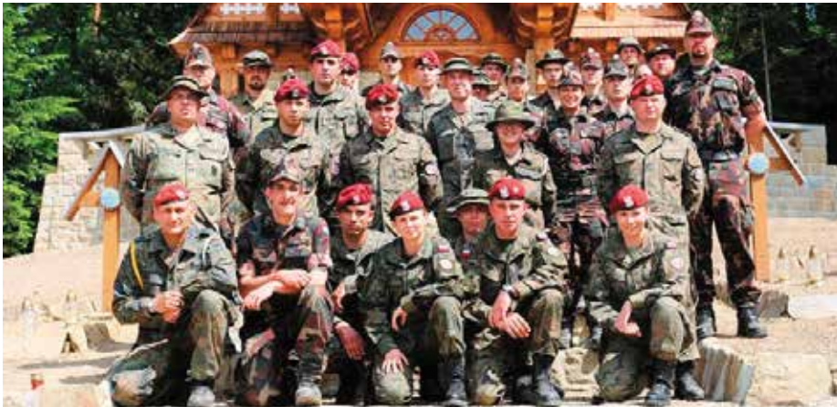
Uczestnicy akcji.

Organizatorem prac ze strony niemieckiej był Volksbund, czyli związek opieki nad grobami. „Nie ma znaczenia jacy żołnierze leżą na cmentarzu. Ważne jest, aby zachować pamięć o wydarzeniach, które rozegrały się tutaj przed laty” - podkreśla dowodzący żołnierzami niemieckimi sierżant major Hendrik Milius. „Niezwykle ważne jest też to, że pracujemy tu razem z żołnierzami z Polski i Węgier” - dodaje podoficer.