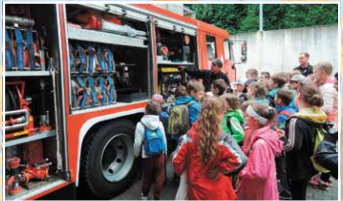
Wizyta u strażaków