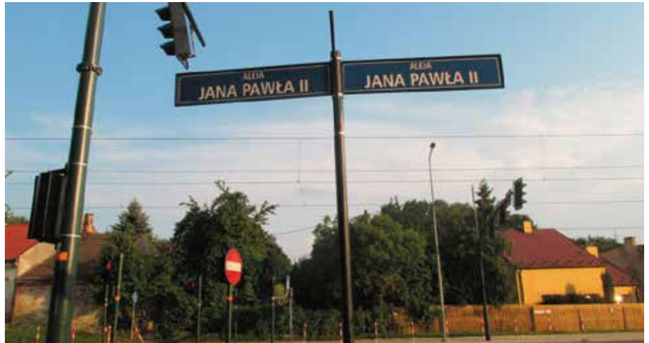
Fragment al. Jana Pawła II przebiegający przez naszą Dzielnicę.

Od 1951 roku był wykładowcą w Metropolitalnym Seminarium Duchownym w Krakowie, w 1953 roku habilitował się na wydziale Teologii UJ, od 1954 roku był kierownikiem Katedry Etyki Katolickiego Uniwersytetu Lubelskiego. W 1958 roku został mianowany biskupem tytularnym Ombrii, a także biskupem pomocniczym Krakowa. Konsekracji biskupiej ks. Karola Wojtyły dokonał 28 września 1958 roku w katedrze na Wawelu metropolita krakowski i lwowski, arcybiskup Eugeniusz Baziak. Półtora roku po śmierci arcybiskupa Baziaka został mianowany arcybiskupem metropolitą krakowskim. Na zwołanym po śmierci Jana Pawła I drugim konklawe w 1978 roku Karol Wojtyła został wybrany na papieża.