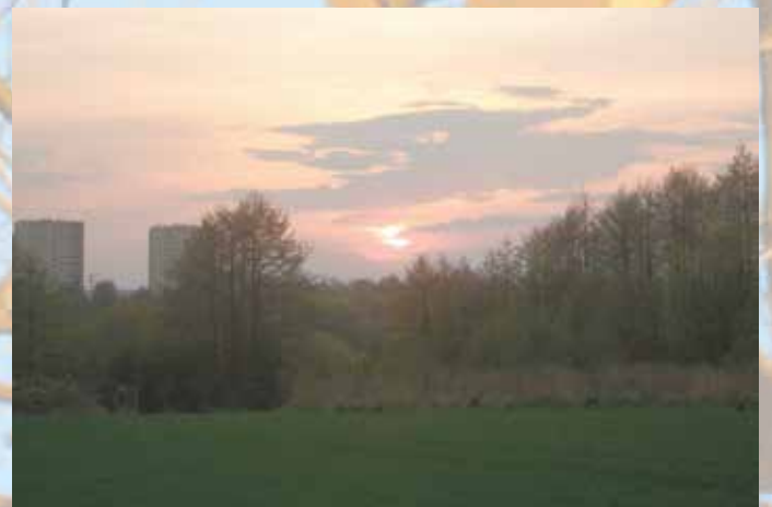
Obecny wygląd terenu przyszłego Parku Reduta.