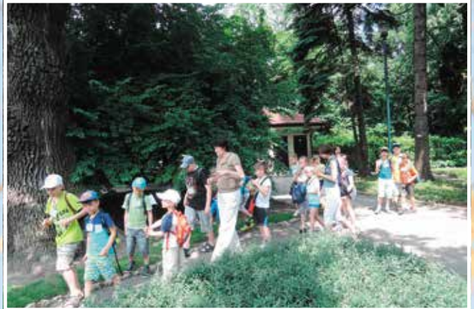
Wizyta w Ogrodzie Botanicznym