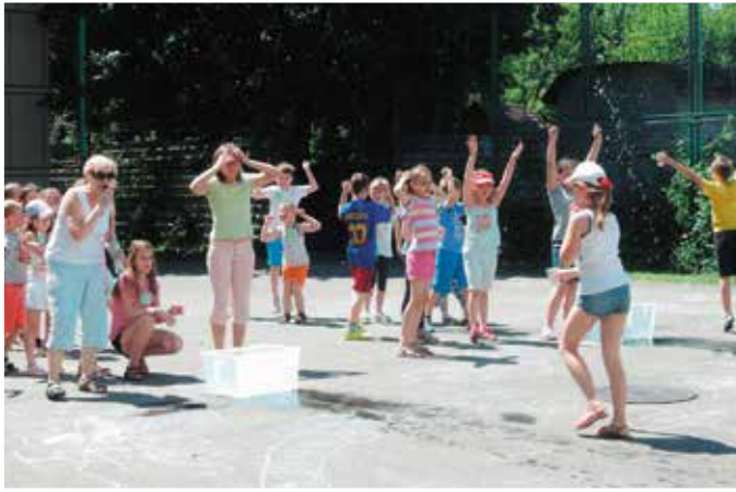
Zajęcia sportowe na boisku przy MDK