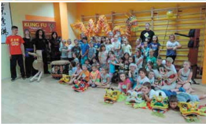
Wizyta w Klubie Choy Lee Fut