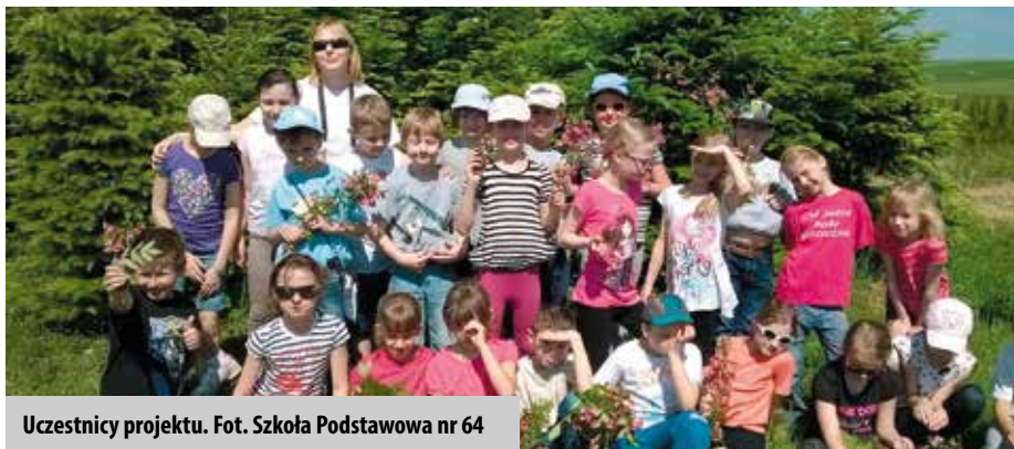
Uczestnicy projektu.

Wycieczka do Gospodarstwa Ekologicznego „Pszczółki” w Pałecznicy była wspaniałą okazją do utrwalenia i zgłębienia wiedzy o pszczole miodnej. Uczniowie poznali warsztat i pracę pszczelarza, mieli także okazję obserwować pszczoły w bezpiecznym domku - ulu inhalacyjnym, spróbować pyłek kwiatowy i miód.