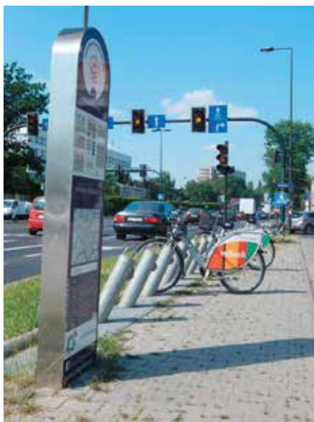
Stacja roweru miejskiego przy al. 29 Listopada.