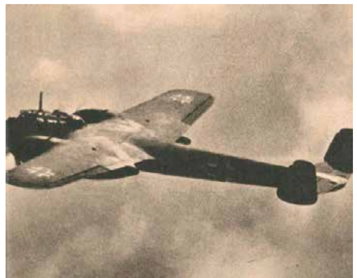
Dornier Do-17 zwany „latającym ołówkiem”.