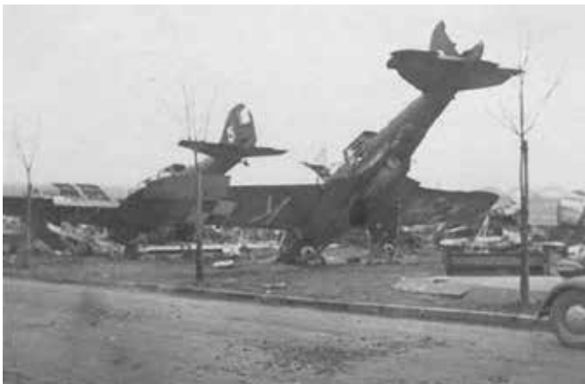
Zbrane przez Niemców zniszczone i uszkodzone polskie samoloty na lotnisku w Rakowicach.

Niemieckie maszyny wracając na zachód po drodze zrzuciły bomby m.in. - na dworzec kolejowy i jego okolice, koszary na Dąbiu i przy ul. Warszawskiej (dzisiejszą Politechnikę Krakowską), boisko Cracovii i w okolicach stadionu Bronowianki w Bronowicach Małych. Ucierpiały także koszary ułańskie w Rakowicach przy dzisiejszej ul. Ułanów, zbiornik wodociągów miejskich w Rakowicach, kaplica pijarska oraz przypuszczalnie domy cywilne w pobliżu lotniska. Niemcy w czasie ataku prowadzili ostrzał z karabinów maszynowych, co spowodowało ofiary śmiertelne m.in. wśród ludności cywilnej w Czyżynach.