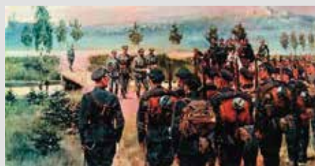
Obraz Jerzego Kossaka, wymarsz I Kompanii Kadrowej z Oleandrów w Krakowie

Konkurs odbędzie się w okresie od 15 września do 15 października 2014 roku. W części literackiej oceniane będą prace pisane poezją lub prozą o objętości nie większej niż dwóch stron A4, zaś w przypadku części plastycznej – prace wykonane dowolną techniką.