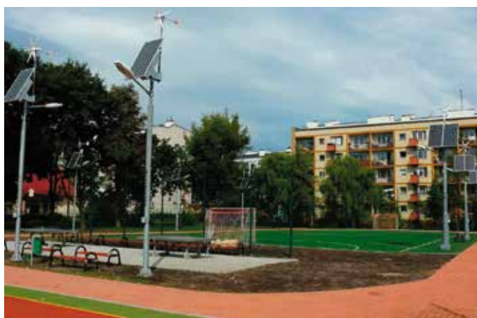
Boiska przy tej samej szkole po modernizacji, 2011 rok