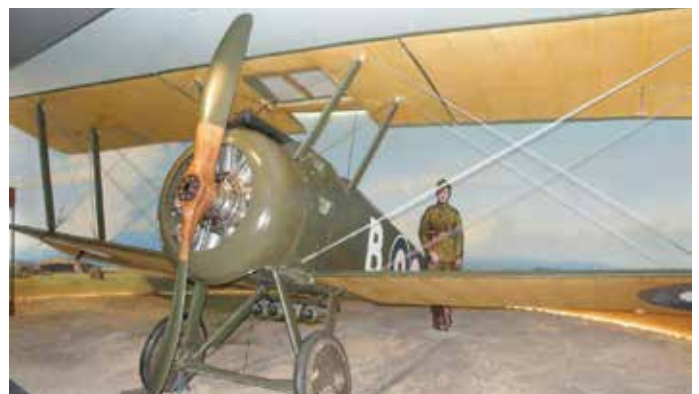
Muzealny Sopwith F.1 Camel.