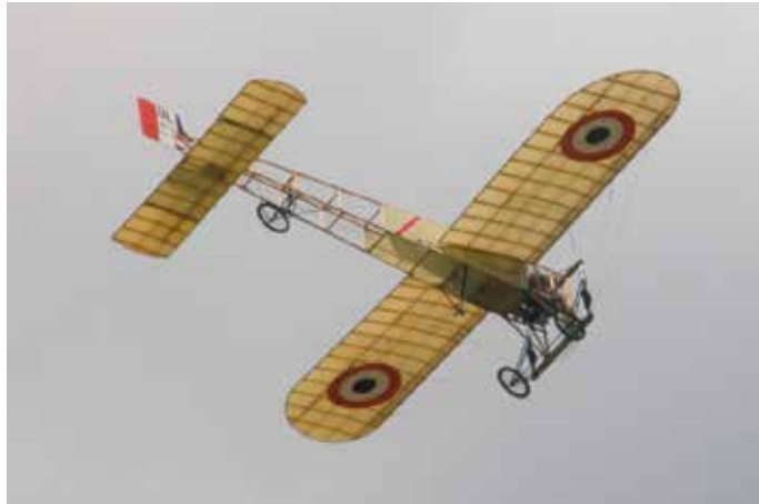
Replika Bleriota XI w locie.

W ramach przygotowań do wystawy w 2013 roku rozpoczął się remont małego hangaru mieszczącego kolekcję samolotów z okresu I wojny światowej. Całkowity koszt prac budowlanych wyniósł 419 tys. zł, z czego 119 tys. zł pochodziło z budżetu Województwa Małopolskiego w ramach Małopolskiego Regionalnego Programu Operacyjnego, a 300 tys. zł z Ministerstwa Kultury i Dziedzictwa Narodowego w ramach programu „Rozwój infrastruktury kultury”. W zakresie przeprowadzonych prac znalazł się m.in. remont ścian zewnętrznych obejmujący pomalowanie, docieplenie i renowację bram oraz modernizację pokrycia dachowego i posadzki. Po zakończeniu