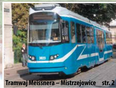
Tramwaj Meissnera – Mistrzejowice str. 2