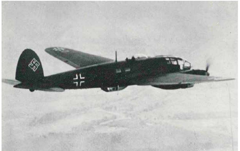
Bombowiec Heinkel He-111.

Lotnisko nie nadawało się do użytku, ale Niemcy nie wykonali swojego najważniejszego zadania – nie zniszczyli polskich maszyn bojowych na ziemi. Te zniszczone w Rakowicach, były maszynami szkolnymi, sporto-