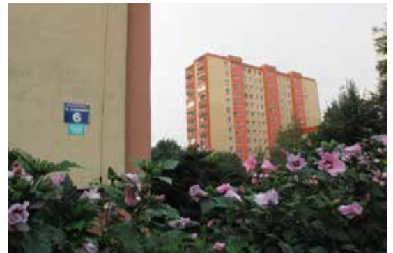
Ul. Mariana Słoneckiego na Prądniku Czerwonym.