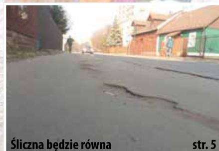
Śliczna będzie równa str. 5