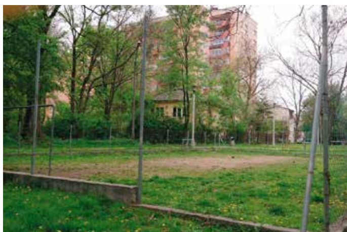
Boisko przy ul. Żytniej stan przed modernizacją, 2013 rok