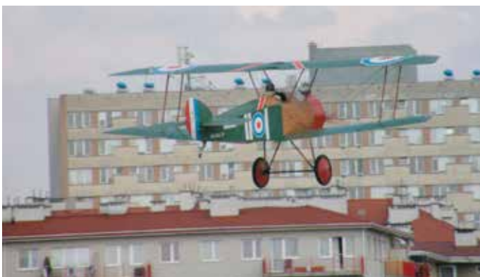
Replika Sopwitha Camela w locie.

Przewodniczący Komisji Informacji i Łączności z Mieszkańcami Rady Dzielnicy III Prądnik Czerwony