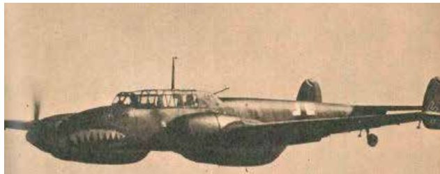
Ciężki myśliwiec Messerschmitt Bf-110.