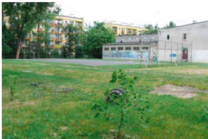
Obiekty sportowe Szkoły Podstawowej nr 114 przed modernizacją, 2010 rok