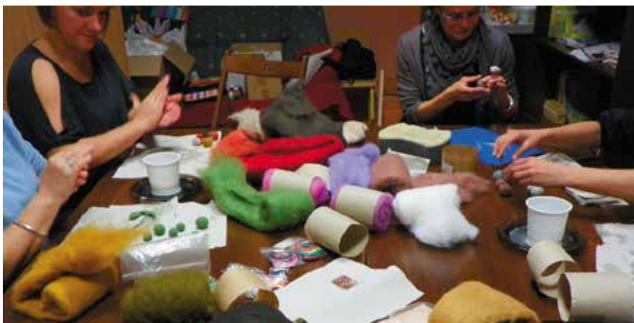
Zajęcia z prowadzonych warsztatów.

W czasie konkursu dzieci wspólnie z naszymi przedszkolakami miały okazję wziąć udział w krakowskich zabawach i zaśpiewać ludowe piosenki