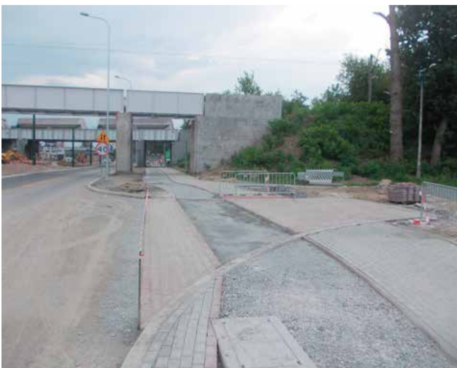
Wlot zaplanowanej drogi łączącej ul. Mogińską z ul. Ostatnią.

członek Zarządu Rady Dzielnicy III Prądnik Czerwonym e-mail: mateusz.drozd@onet.pl