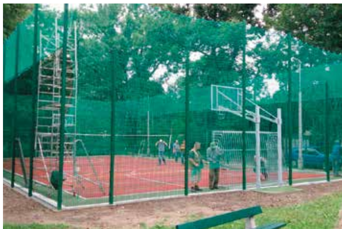
Boisko przy ul. Żytniej w trakcie prac modernizacyjnych, 2014 rok