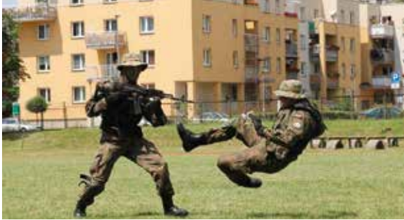
Pokazy sprawności żołnierzy.

27 czerwca swoje święto oraz piętnastą rocznicę utworzenia obchodził 6. Batalion Dowodzenia im. gen. broni Józefa Kuropieski. Jednostka, stacjonująca obecnie w rakowickich koszarach przedwojennego 8. Pułku Ułanów im. Księcia Józefa Poniatowskiego i 2. Pułku Lotniczego, powstała w 1999 roku w wyniku reorganizacji ówczesnej 6. Brygady Desantowo – Szturmowej. Od tego czasu głównym jej zadaniem jest zabezpieczenie rozwinięcia i funkcjonowania