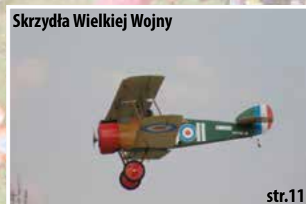
Skrzydła Wielkiej Wojny