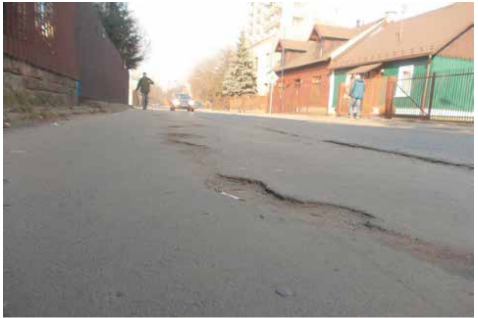
Nawierzchnia ul. Ślicznej.

Do sprawy powróciliśmy w ubiegłym roku. Chodniki ul. Ślicznej na odcinku od ul. Ostatniej do ul. Meissnera po stronie południowej i od ul. Meissnera do wjazdu na osiedle przy bloku Śliczna 12A zostały na mój wniosek wpisane na listę remontów w naszej Dzielnicy. Razem z ul. Śliczną znalazły się tam m.in.