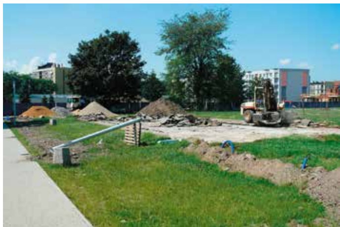
Budowa boiska w Parku Zaczarowanej Dorożki, 2010 rok