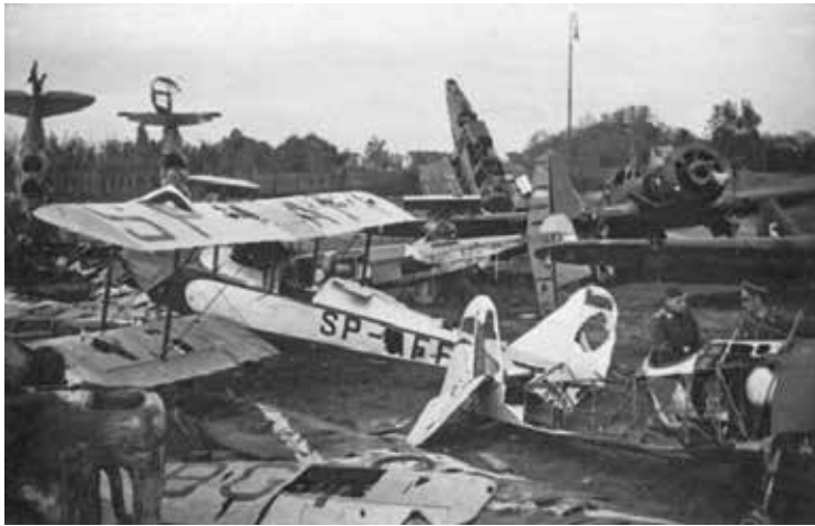
Zbrane przez Niemców zniszczone i uszkodzone polskie samoloty na lotnisku w Rakowicach.

Pierwsze samoloty niemieckie pojawiły się nad lotniskiem Rakowice-Czyżyny przed godz. 5.30 rano 1 września 1939 roku. Było ich dwanaście, nadleciały od strony Śląska, były to dwusilnikowe ciężkie myśliwce Messerschmitt Bf-110 które krążyły na dużej wysokości nad Rakowicami. Nie atakowały, miały tylko zabezpieczyć swoich kolegów, którzy mieli zaatakować krakowskie lotnisko. I faktycznie, niedługo po myśliwcach od strony wschodniej – dzisiejszej Nowej Huty – nadleciały na wy-