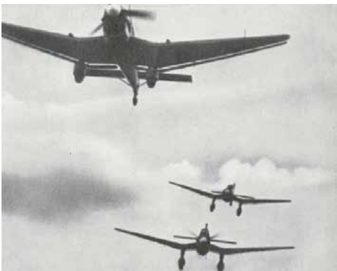
Stukasy - bombowce nurkujące Junkers Ju-87 Stuka.