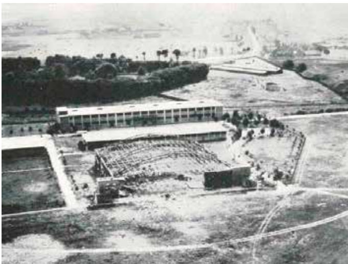
Uszkodzony hangar, późniejszy hangar wystawowy Muzeum Lotnictwa Polskiego, z tyłu widoczny jest nieistniejący obecnie fort Pszorna.

Być może zechcieliby się Państwo nimi podzielić z autorem tekstu Wszystkich chętnych do rozmów o wydarzeniach z września 1939 roku proszę o bezpośredni kontakt mailowy ( mateusz.drozd@onet.pl ) lub telefoniczny (605 44 88 01).