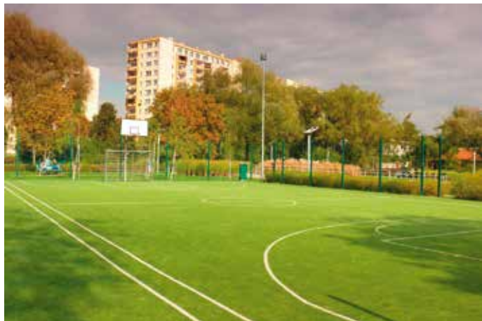
Boisko w Parku Zaczarowanej Dorożki, 2013 rok