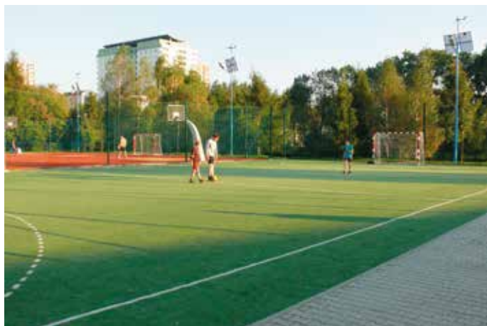
Boiska przy Szkole Podstawowej nr 2, 2010 rok