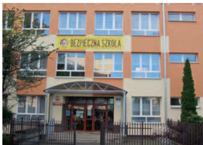
To samo wejście po termomodernizacji