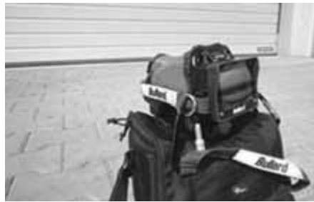
Kamera termowizyjna.

Rejon działania Jednostki Ratowniczo-Gaśniczej nr 7 jest dość duży. Obejmuje Dzielnicę III i XV oraz częściowo Dzielnicę IV i XIV Krakowa oraz część powiatu krakowskiego (m.in. takie miejscowości jak Zielonki, Słomniki, Michałowice).