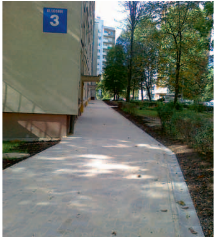
Nowy chodnik przy ul. Ugorek 3.