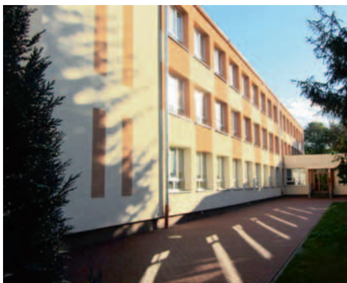
Gotowy budynek Szkoły Podstawowej nr 64 po stronie zachodniej