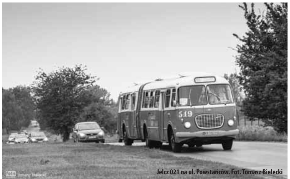
Jelcz 021 na ul. Powstańców.

W tym roku Krakowska Linia Muzealna kursowała co niedzielę w okresie od 1 lipca do 16 września oraz dodatkowo w środę 15 sierpnia i w sobotę 22 września. Zabytkowy tabor zawitał również do naszej Dzielnicę. Tramwaje dwukrotnie w ciągu dnia pokonywały trasę z Muzeum Inżynierii Miejskiej