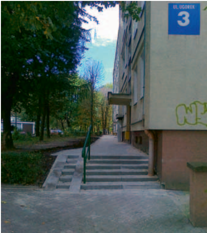
Nowe schody przy ul. Ugorek 3.