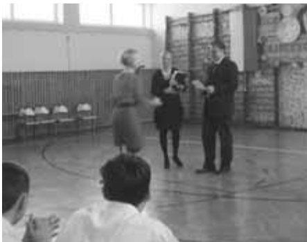
Wręczenie dyplomów dla nagrodzonych pedagogów.

Z okazji Święta Edukacji Narodowej przypadającego na dzień 14 października Specjalny Ośrodek Szkolno Wychowawczy dla Dzieci Nieśłyszących im. Jana Sierzyńskiego w Krakowie zorganizował uroczyste obchody. Uczniowie klas podstawowych oraz gimnazjalnych przygoto-