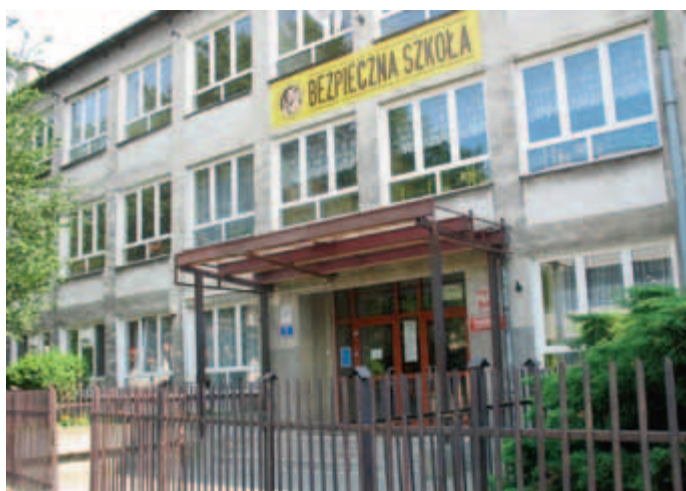
Wejście do budynku Szkoły Podstawowej nr 64 przed termomodernizacją