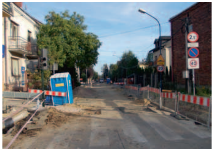
Remont ul. Widnej.