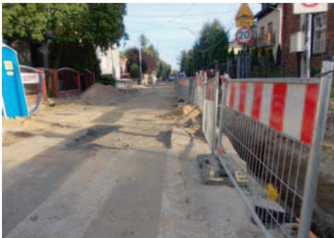
Remont ul. Widnej.