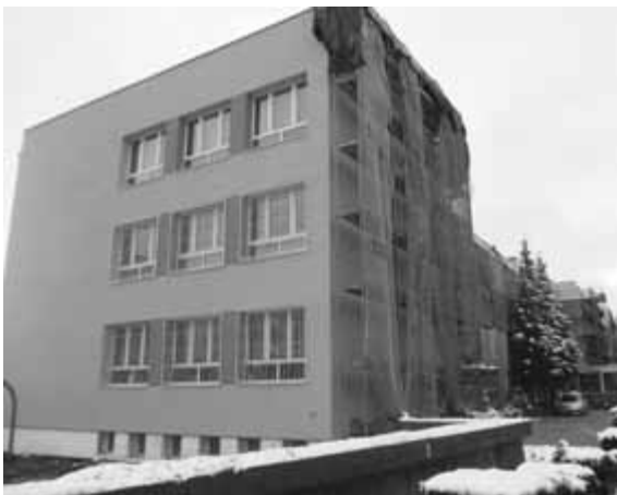
Budynek Gimnazjum nr 9 i XXI Liceum Ogólnokształcącego przy ul. Kazimierza Odnowiciela.

Jadwiga Jaworska dyrektor Gimnazjum nr 9 im. Stanisława Wyspiańskiego