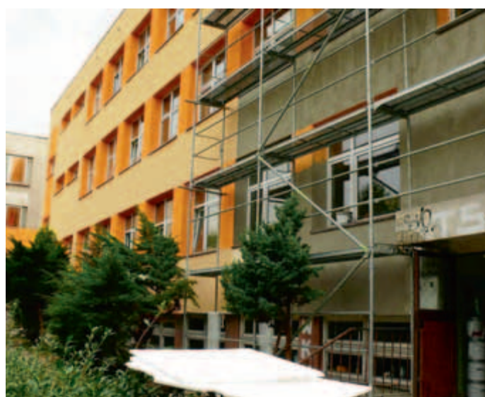
Widoczna różnica pomiędzy starą a nową elewacją. Ta nowa będzie zabezpieczona warstwą antygraffiti