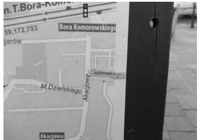
Turkusowa zamiast „Truskawkowej” i Cieśliewskiego zamiast „Cieślowskiego” to poprawione już błędy na planach MPK.