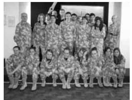
Klasa mundurowa.