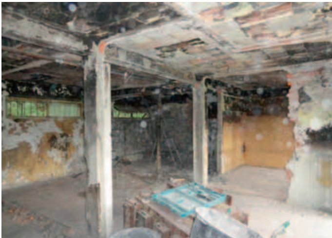
Budynek szatni KS Prądniczanka.