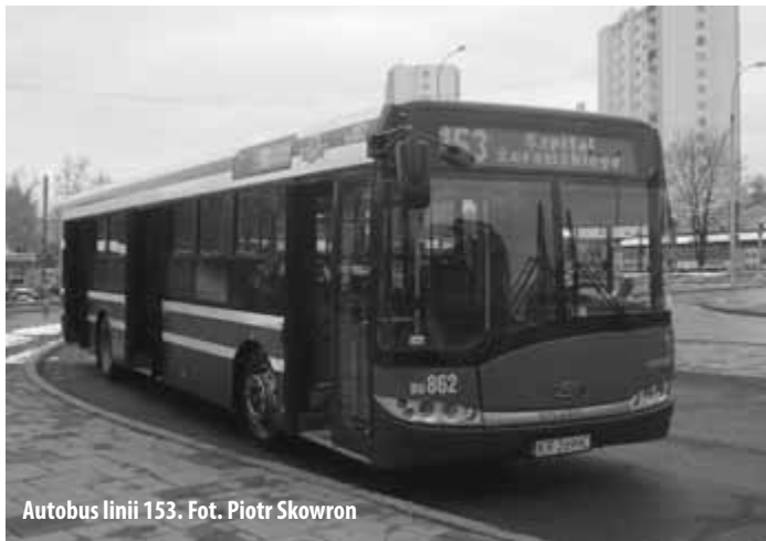
Autobus linii 153.