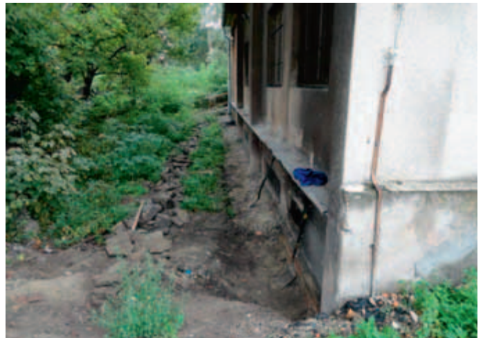
Budynek szatni KS Prądniczanka.