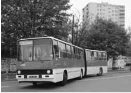
Ikarus 280 na ul. Strzelców.

przez ul. Mogiłską i al. Jana Pawła na Wieczystej do Kopca Wandy. Linia obsługiwana była przez składy Sanok SN1-Man PN3, Linke Hofmann, Sanok SN2-Sanok PN2, Konstal N-Konstal ND i Konstal 102N.