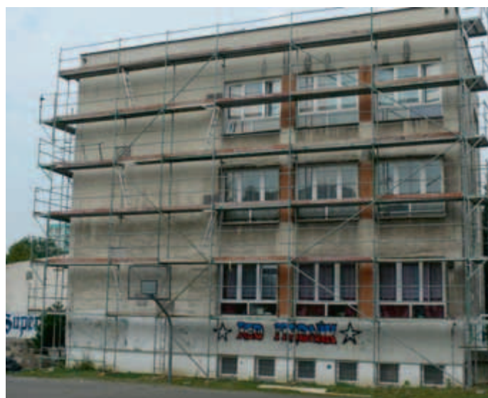
Przy Gimnazjum nr 9 rusztowania stoją...