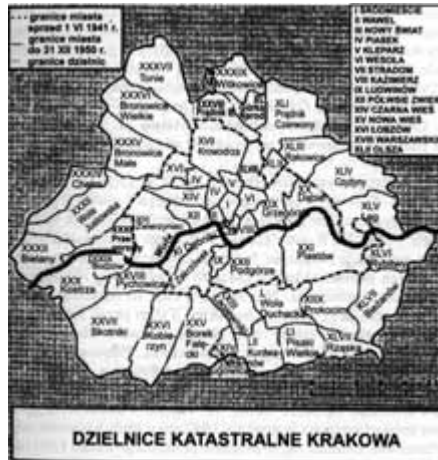
Mapa Krakowa z lat okupacji za: Krzysztof Broński, „Ruch budowlany w Krakowie pod okupacją hitlerowską”, „Rocznik Krakowski”

Rada Miasta zaakceptowała przedstawiony plan, przedłożyła go do Sejmu Krajowego, który