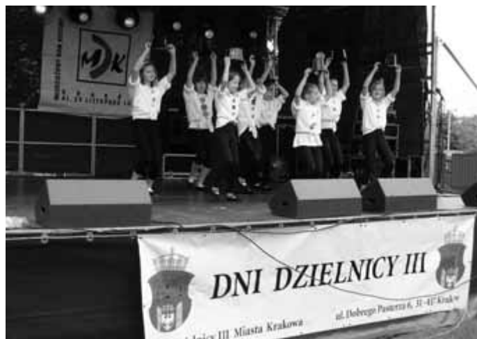
Występ młodzieży podczas Dni Dzielnicy III.