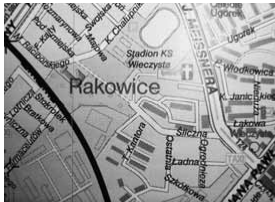
Przejście nadal jest zaznaczone na planach miasta Krakowa.

Stary przebieg ścieżki biegnie obecnie przez tereny dwóch osiedli zarządzanych przez wspólnoty mieszkaniowe, teren będący placem budowy ko-