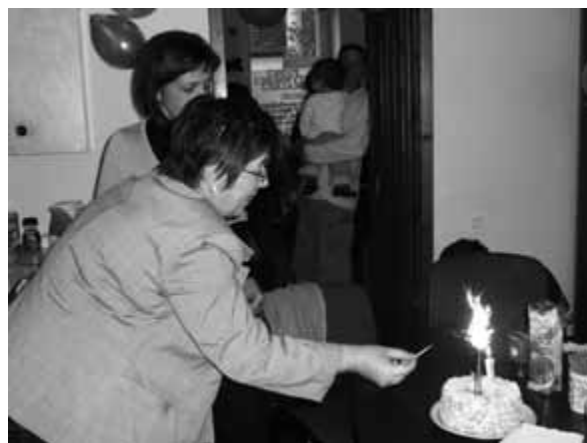
Punkt Aktywności Lokalnej.

Lokalne organizacje pozarządowe ubiegać się mogą o dofinansowanie inicjatyw charytatywnych i organizacji wycieczek dla dzieci oraz młodzieży w ramach corocznego Otwartego Konkursu Ofert (dwie edycje wiosenna i jesienna). Dofinansowanie swoich inicjatyw cyklicznie otrzymują: Fundacja Oświatowa o. o. Pijarów, organizacje parafialne, zrzeszenia rencistów i emerytów, świetlice środowiskowe oraz inne organizacje pozarządowe działające na terenie Dzielnicy.