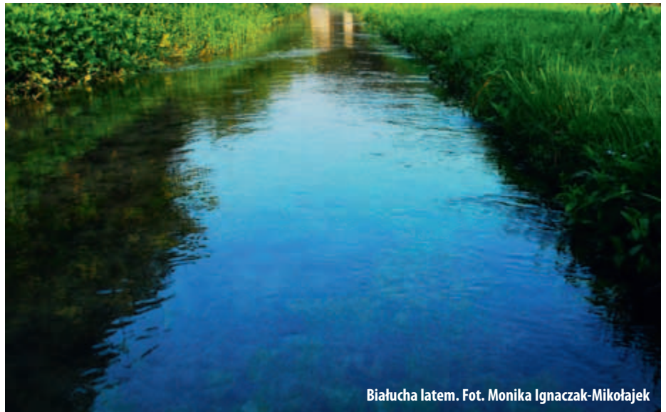
Białucha latem.

Mam jednak nadzieję, że mieszkańcy wspólnie z Radą Dzielnicy III przyczynią się do ochrony dawnej naszej osiedlowej rzeki, aby obecne i przyszłe pokolenia mogły cieszyć się jej urokami. Spę-