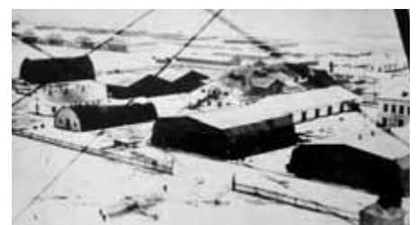
Rakowice tuż po wyzwoleniu w 1918 roku.