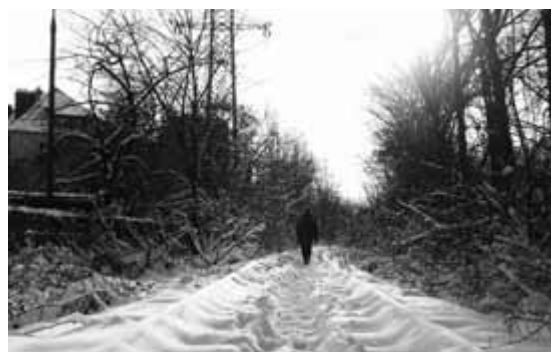
Jedynym istniejącym obecnie skrótem jest równoległa do byłej ścieżki bocznicza kolejowa.

lejnego osiedla i działkę gminną w pobliżu ul. Chałupnika. Wytyczenie przejścia przez teren należący do gminy nie byłoby problemem, ale jest nim w przypadku terenów prywatnych. Aby przywrócić przejście po dawnym przebiegu wymagana byłaby zgoda większości współwłaścicieli terenu osiedla Śliczna 30 – właścicieli tamtejszych mieszkań,