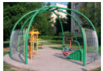
Przykład innego placu zabaw zrealizowanego przez Radę Dzielnicy III przy ul. Miechowity.