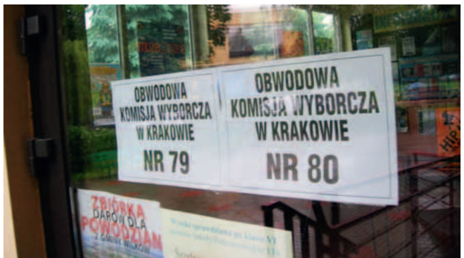
W styczniu znów będziemy mogli odwiedzać nasze lokale wyborcze.

Przewodniczący Komisji Infrastruktury i Budownictwa Rady Dzielnicy III Prądnik Czerwony ostatniej kadencji