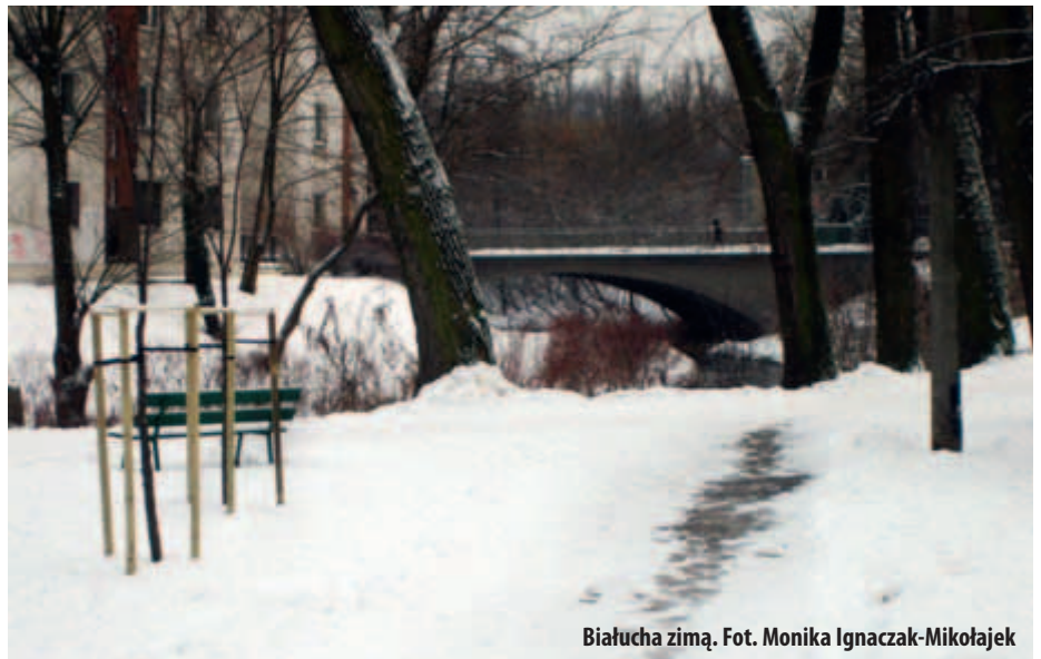
Białucha zimą.