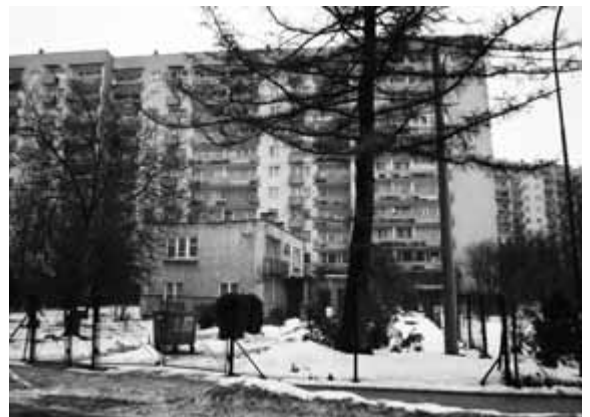
Miejsce ewentualnej inwestycji.

Mateusz Drożdż radny Dzielnicy III Prądnik Czerwony w latach 2006-2010 e-mail: mateusz.drozd@onet.pl