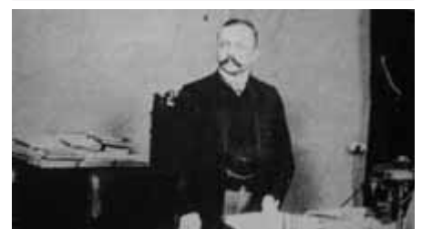
Twórca Wielkiego Krakowa – prezydent Juliusz Leo.