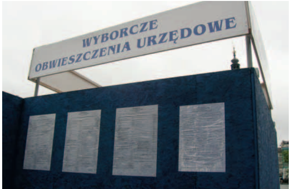
Wybory do rad dzielnic odbędą się w niedzielę 9 stycznia 2011 roku.

Zwracajcie Drodzy Mieszkańcy swoją uwagę na ludzi, na kandydatów do Rady Dzielnicy. Nie głosujcie w ślepo. Spytajcie: kim jest moja kandy-