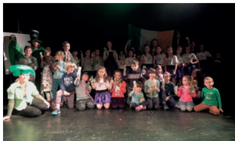
Dzień św. Patryka na scenie teatralnej MDK.

Dzień św. Patryka to nie tylko najbardziej znane święto irlandzkie, ale również najbardziej zielony dzień roku. Tego szczególnego dnia Irlandczycy na całym świecie ubierają się na zielono, spożywają zielone potrawy i napoje, na zielono podświetlane są budowle, barwione rzeki, a nawet wodospady. Święto to zagościło też na stałe w Młodzieżowym Domu Kultury przy al. 29 Listopada 102. Co roku, w okolicach 17 marca, wiele dzieci i rodziców przybywa na spotkanie z kulturą Zielonej Wyspy.