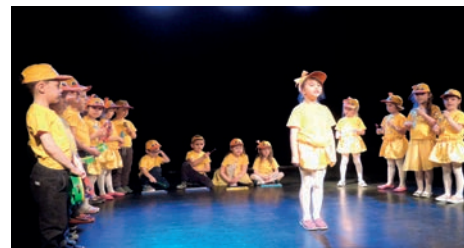
Młodzi artyści z przedszkoli z terenu Dzielnicy III.

dla dzieci i ich opiekunów. Piosenki znane wszystkim zyskały nowe brzmienie, ciekawie wykorzystano proste rekwizyty. Przygotowane prezentacje podkreślały dziecięcą radość i spontaniczność. Do przeglądu zgłosiło się 12 grup, wśród których byli przedstawiciele Przedszkoli nr 65, 123 i 178. Jury zdecydowało się przyznać dwie nagrody oraz wyróżnienie. A już zimą zapraszamy grupy przedszkolne na kolejne sceniczne spotkania w ramach „Przeglądu jasełek, kołęd i pastorałek”.