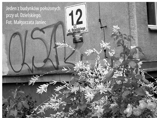
Jeden z budynków położonych przy ul. Dzielskiego.

Po powstaniu „Solidarności” w końcu 1980 r. został doradcą Komisji Robotniczej Hutników NSZZ „S”, a w 1981 r. członkiem Sekcji Informacji